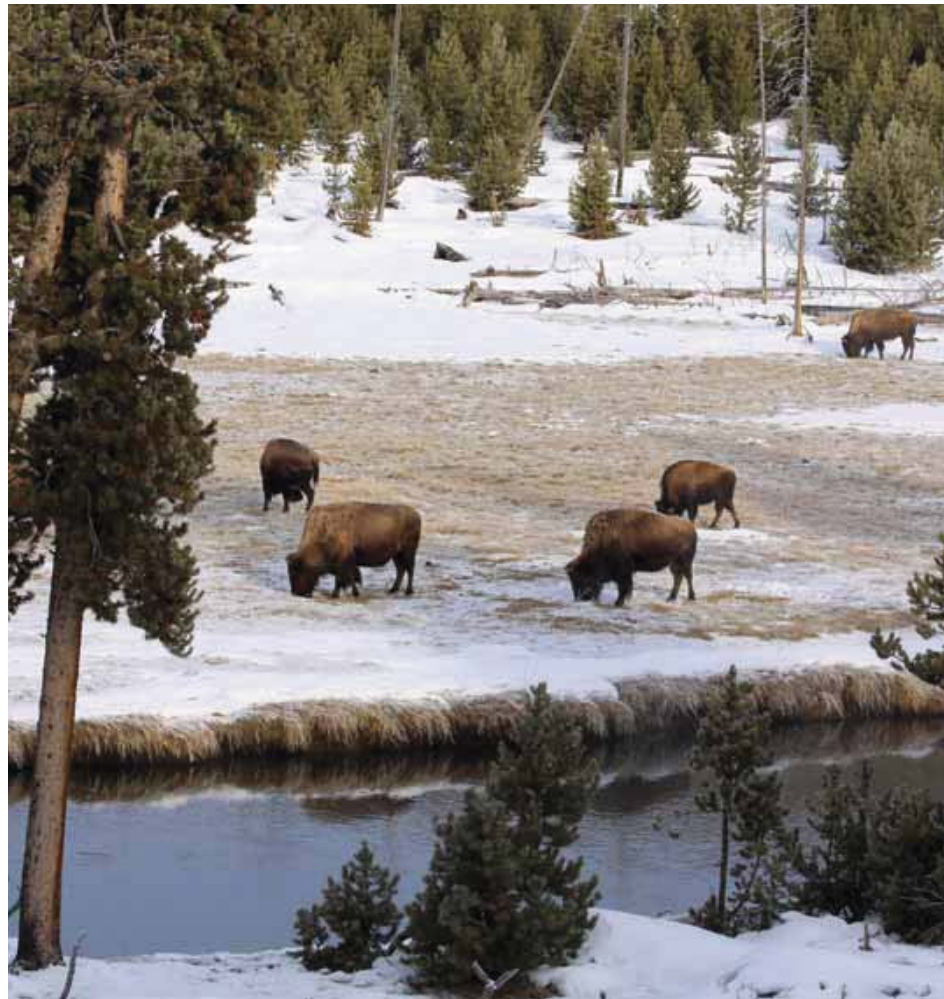
Langs de Firehole River.

heuvel ontvouwt zich een intrigerend schouwspel, alsof er zojuist een flinke brand heeft gewoed en de resten van het bos liggen na te smeulen. Er is nagenoeg geen sneeuw, alleen her en der een witte vlek. De laagstaande zon dringt door een lichte sluier ochtendmist, overal komen rookpluimen uit de grond. Wit uitgeslagen karkassen van bomen in ontbinding liggen willekeurig verspreid in de licht-glooiende vlakke waar nauwelijks begroeiing is. Hier en daar heeft een groepje met sneeuw bedekte naaldbomen de vlammen ontlopen. Tenminste zo lijkt het; maar er is de afgelopen tijd helemaal geen brand geweest. De rook is bij nader inzien waterdamp. Hier ligt de geothermische activiteit vlak onder de oppervlakte en prikt er heel vaak doorheen. Dat is goed te merken aan de rotte-eierenlucht.