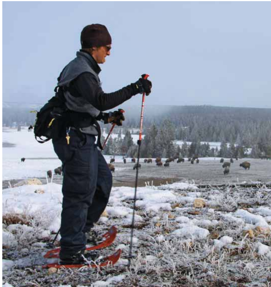
De scharrelende bizens op veilige afstand ogen vredig.

laatste park is het oudste ter wereld, het is opgericht in 1872. Geen wonder dat ze dit gebied wilden behouden. Je valt hier van ene geologische verbazing in de andere. Het park ligt deels op een enorme vulkaanrater van zo'n 3800 vierkante kilometer waarvan sommige wetenschappers verwachten dat die nog een keer zal uitbarsten en een vernietigend effect zal hebben op Noord-Amerika. Voorlopig is er nu ook al veel geothermische activiteit, zij het op bescheidener schaal. Dat maakt het park in de winter zo bizar. Terwijl de thermometer ver onder nul zakt, spuit de Old Faithful vrolijk elke 92 minuten tienduizenden liters kokend heet water tot zo'n vijftig meter de lucht in. Rondom de geiser is een modderpoel die er zomer en winter ongeveer hetzelfde uitziet, twintig meter verderop zak je weg in metersdiepe sneeuw. Op veel meer plaatsen in het park slaat de stoom uit de grond en pruttelt, borrelt en reutelt het hete damp. De Old Faithful is lang niet de enige geiser van de klok. Ook de Lonestar Geyser, een soort wrat op een open plek in een bosachtige omgeving, houdt van regelmaat. Elke drie uur barst de Lonestar uit, wel een half uur lang. Deze erupties hebben een sprookjesachtig effect op de omgeving; dikke lagen rijp op de bomen en struiken. De warme waterdamp slaat neer en vormt de prachtigste ijskristallen.