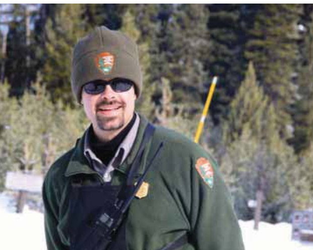
Park rangers houden een oogje in het zeil..