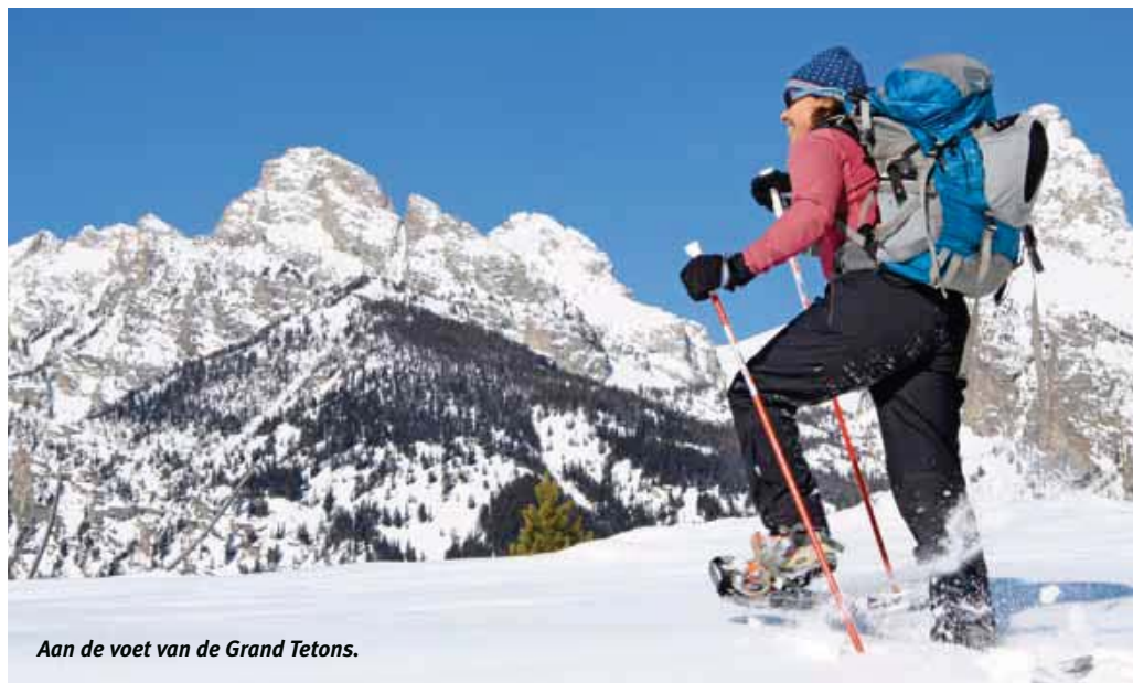
Aan de voet van de Grand Teton.

Waar Grand Teton een alpien voorkomen heeft met spitse pieken die hoog oprijzen uit de hoogvlakte, is Yellowstone meer glooiend. Dit