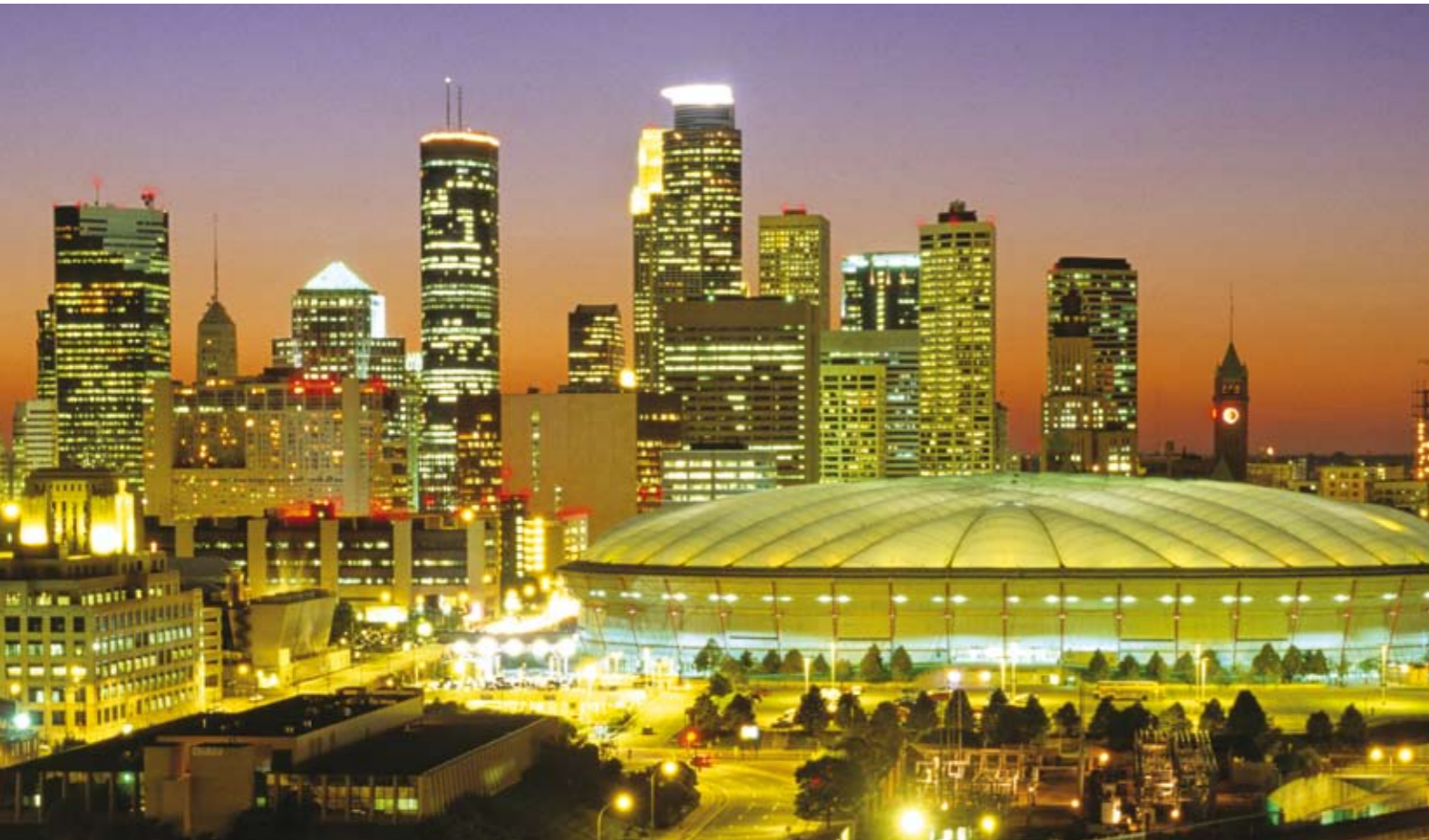
FOTO ONDER SKYLINE MINNEAPOLIS.