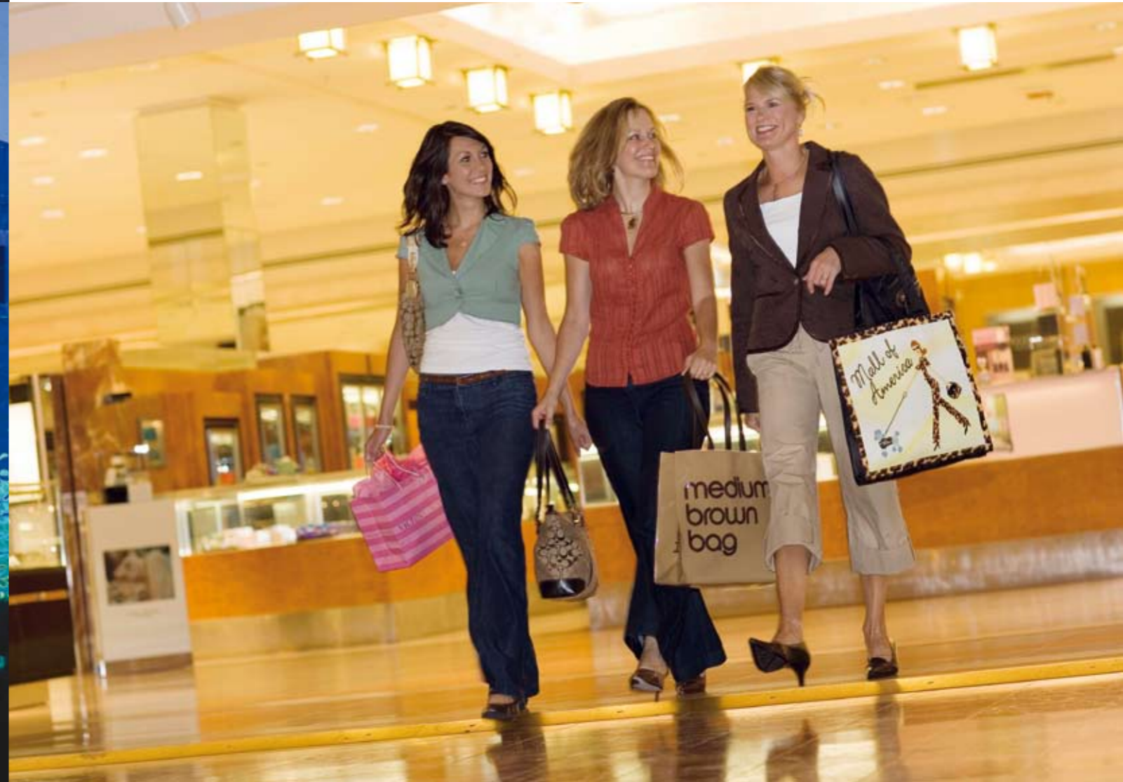
FOTO BOVEN MALL OF AMERICA SIGN.