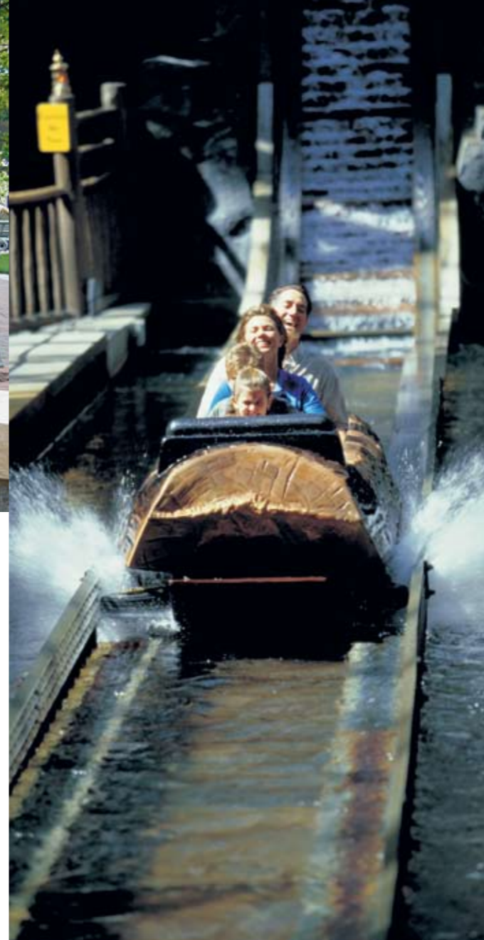
FOTO LINKS WATER PARK OF AMERICA.