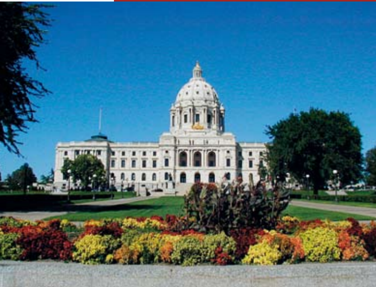
FOTO BOVEN STATE CAPITOL.

Wist je dat in Minnesota meer golfers wonen dan in welke andere staat in Amerika dan ook? Dit heeft niet alleen gevolgen voor de kwantiteit, maar vooral ook voor de kwaliteit van de golfbanen in deze staat, zoals bijvoorbeeld de Brainerd Golf Trail en Cragun's on Gull Lake, beide bekroonde banen. De beroemde Hazeltine National Golf Club in Chaska organiseerde in 2002 het PGA kampioenschap en heeft in 2009 nogmaals deze eer.