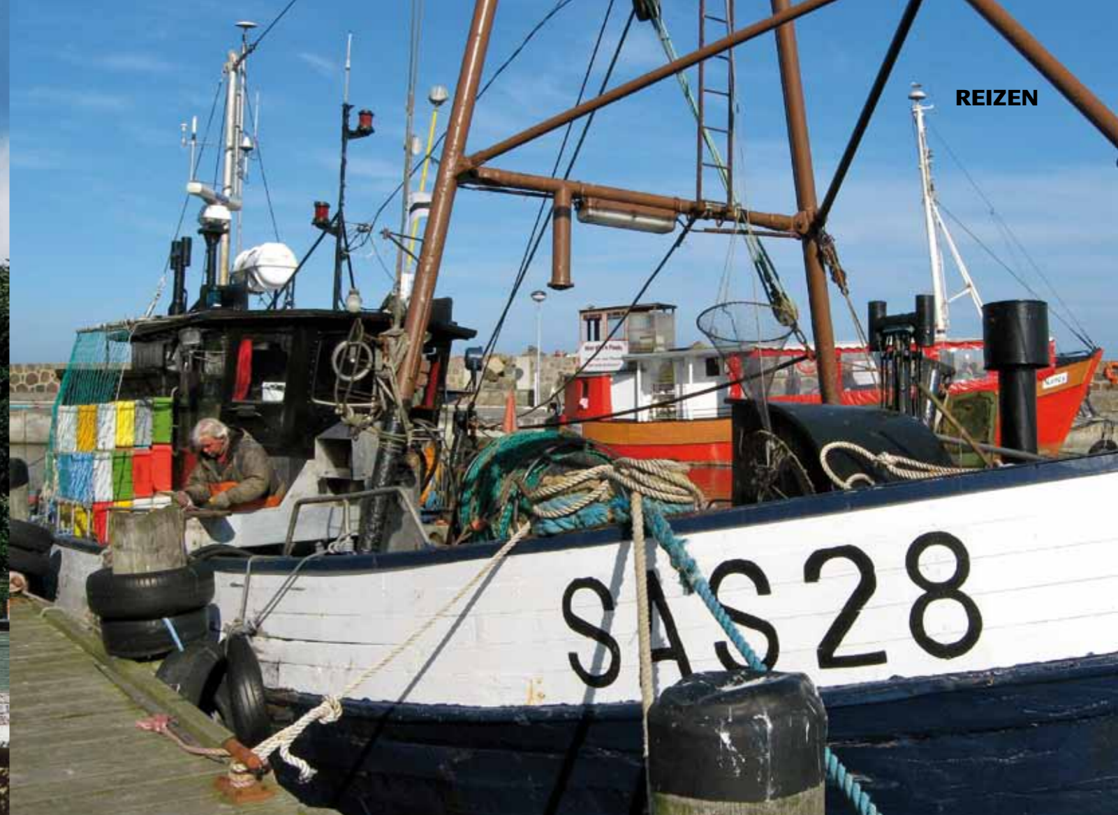
FOTO BOVEN VISSERSBOOT IN DE HAVEN VAN SASSNITZ.