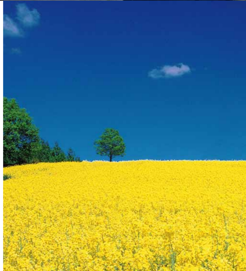
FOTO LINKS BLOEIENDE KOOLZAADVelden KLEUREN HET EILAND GEEL.