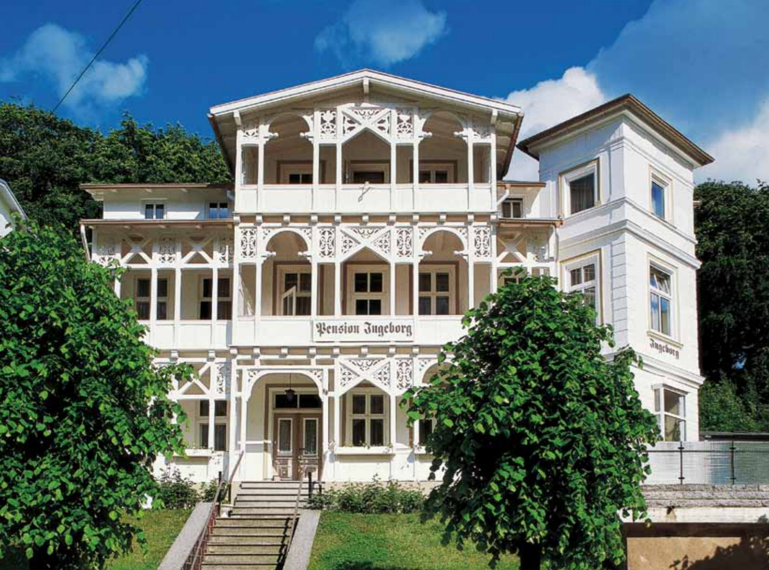
FOTO BOVEN VOORBEELD VAN EEN PENSION IN JUGENSTILL.