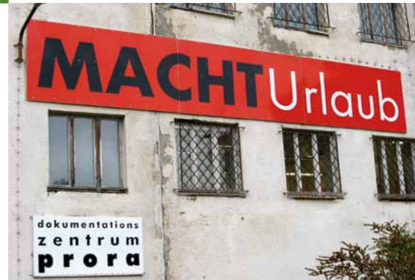
FOTO RECHTS ONDER EEN OVERZICHTSFOTO VAN DE KOLOS VAN PRORA.