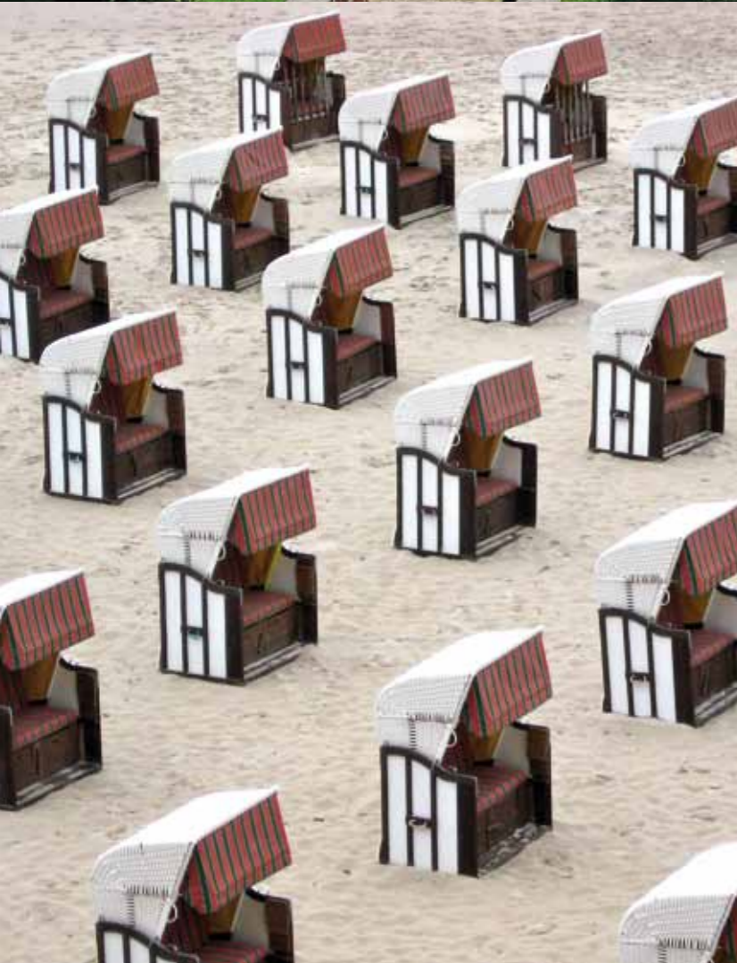
FOTO LINKS OUDERWETSE RIETEN STRANDSTOELEN ZORGEN VOOR EEN NOSTALGISCH VAKANTIEGEVOEL.