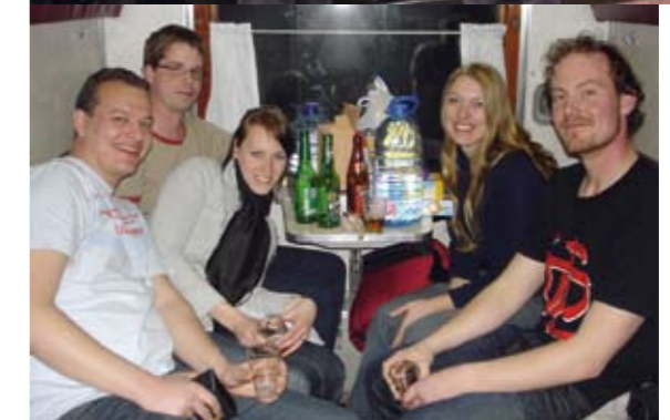
FOTO LINKS FEEST IN DE COUPÉ.

en staat daar vaak een altaar dat versierd is met afbeeldingen van Buddha en familiefoto's. In het mannengedeelte wordt de melkvoorraad opgeslagen terwijl in het vrouwengedeelte kookgerei en waterkannen te vinden zijn. Tegen de wanden staan vaak rijk beschilderde bedden en kastjes en in het midden staat een tafel met een paar kleine stoeltjes. Het is een unieke belevenis om eens in zo'n gertent te overnachten.