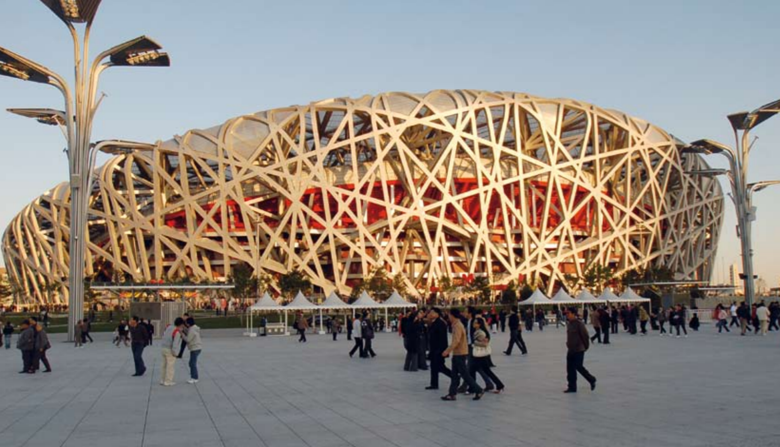
FOTO BOVEN OLYMPISCH STADION.