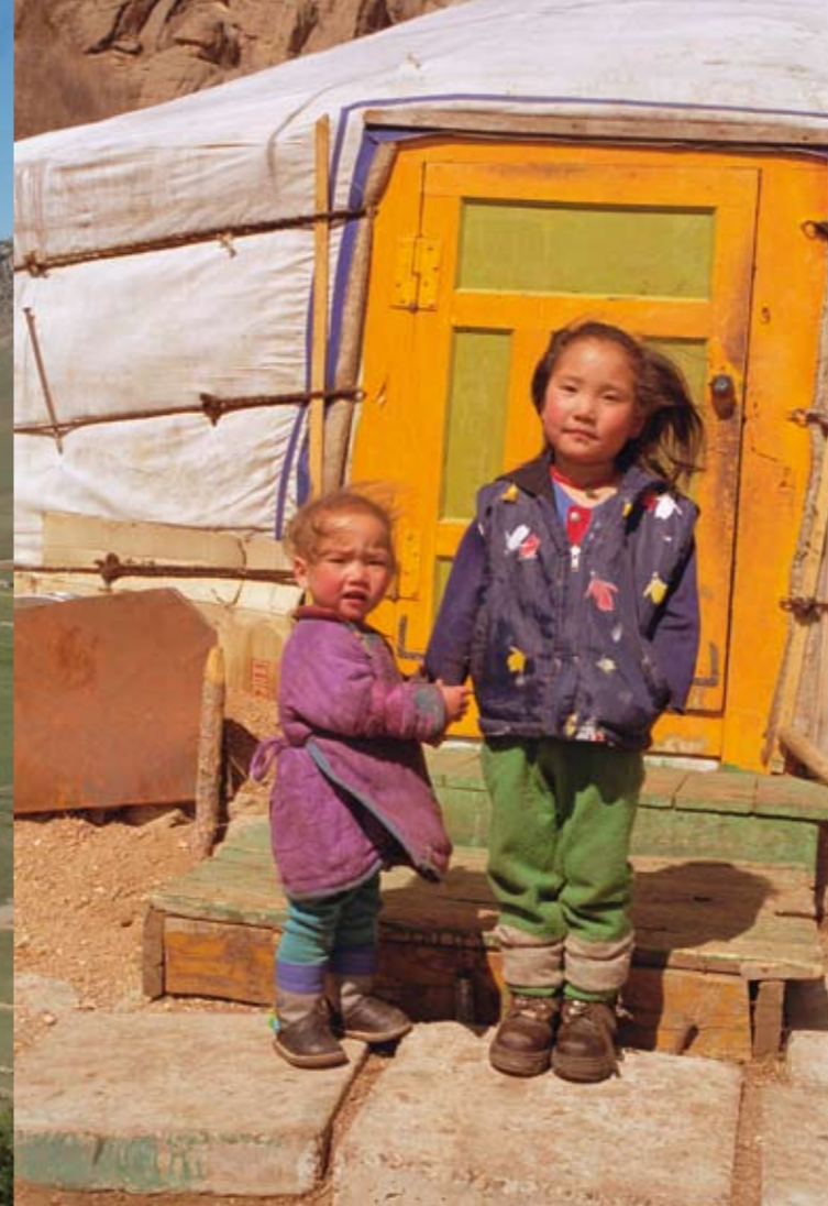
FOTO LINKS TRADITIONELE GERTENT.