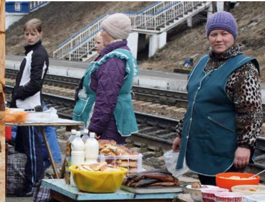
FOTO RECHTS BOVEN HANDEL OP HET PERRON.

Het leven in de trein is met niets te vergelijken. Het is alsof het grote Siberië je naar het oosten zuigt. De trein dendert in een gestaag tempo voort. Uitgestrekte berkenwouden, gigantisch brede rivieren, taiga's en de Mongoolse hoge graslanden trekken aan het treinraampje voorbij, net als dorpjes en steden waarvan de namen niet eens uit te spreken zijn. Treinpassagiers strekken hun benen op één van de vele stations waar kort gestopt wordt. Na een dagje wennen aan het leven in de trein, ontspannen de reizigers zichtbaar. Hier geldt het jachtige leven zoals in Nederland niet zo. Iedereen gunt zich tijd voor een praatje, een dutje, een lekker hapje, een spelletje en het genot van een drankje. De coupés in de trein bieden een zekere mate van comfort. In een 4-persoonscoupé heeft iedereen een eigen bed, dat overdag als zitplaats gebruikt wordt. Onder de onderste bedden is een beperkte bagageruimte aanwezig en ook boven de ingang is opslagruimte beschikbaar. Veel kleding meenemen is overigens niet nodig, want eindstation Beijing biedt een keur aan markten waar met wat onderhandelingen prima goedkope kleding in te slaan is. Per 2 wagons is er een samovar; een heetwaterketel, waaruit 24 uur per dag heet water getapt kan worden. Zo kan iedereen zelf