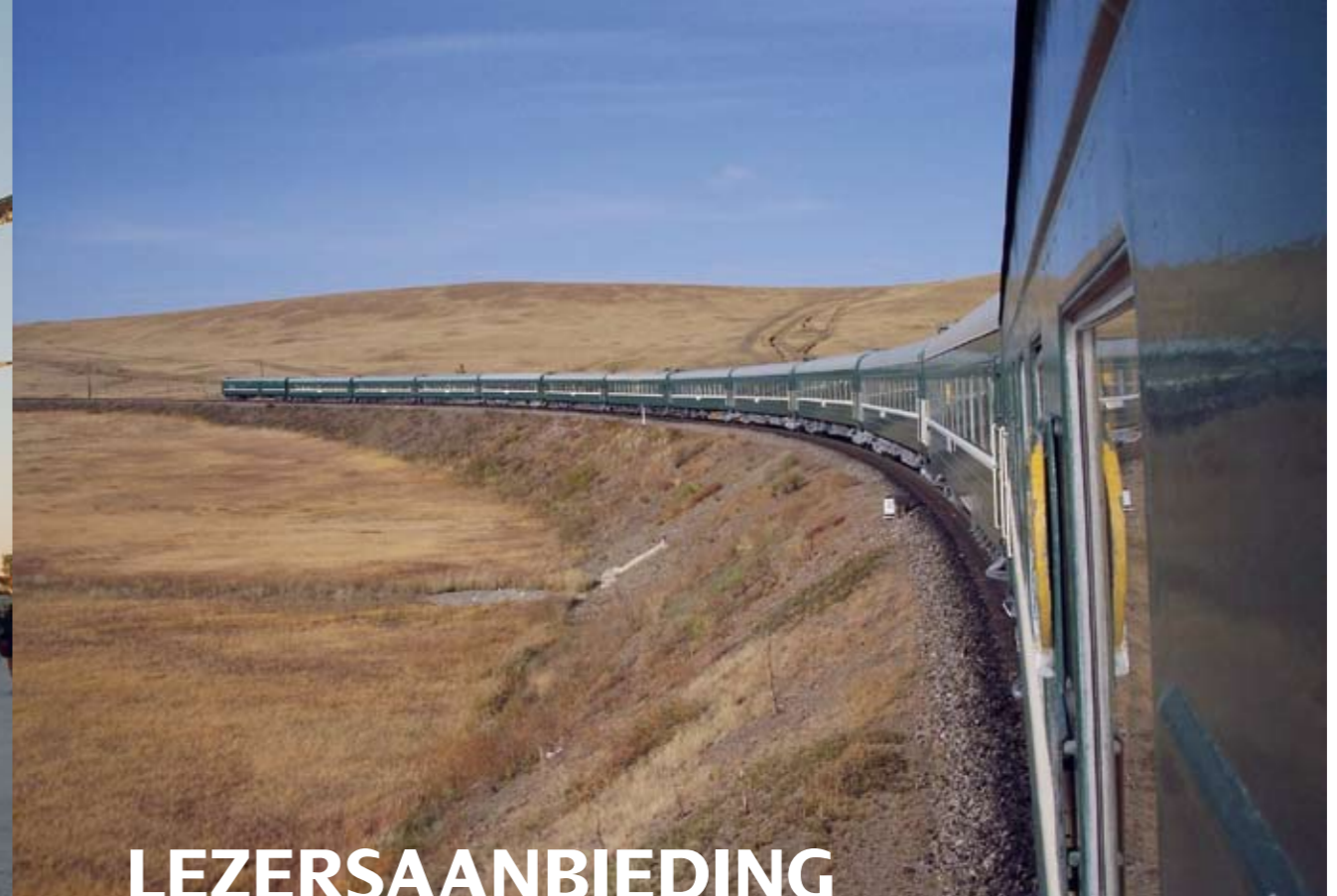
FOTO LINKS GOBI WOESTIJN.