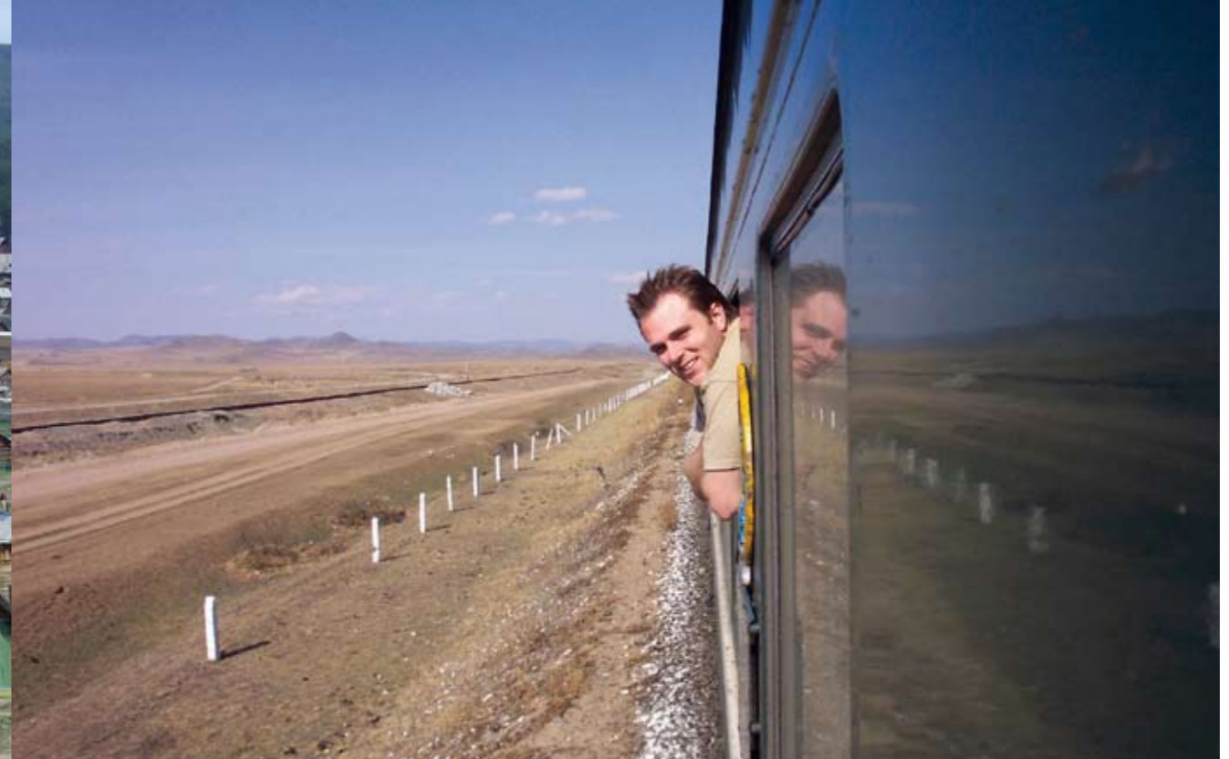
FOTO LINKS UITZICHT OP DE GOBI WOESTIJN.