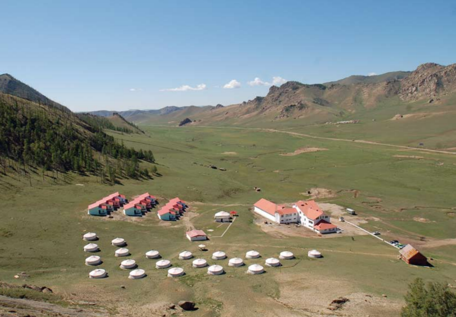
FOTO BOVEN TIARA RESORT IN TERELJ N.P.