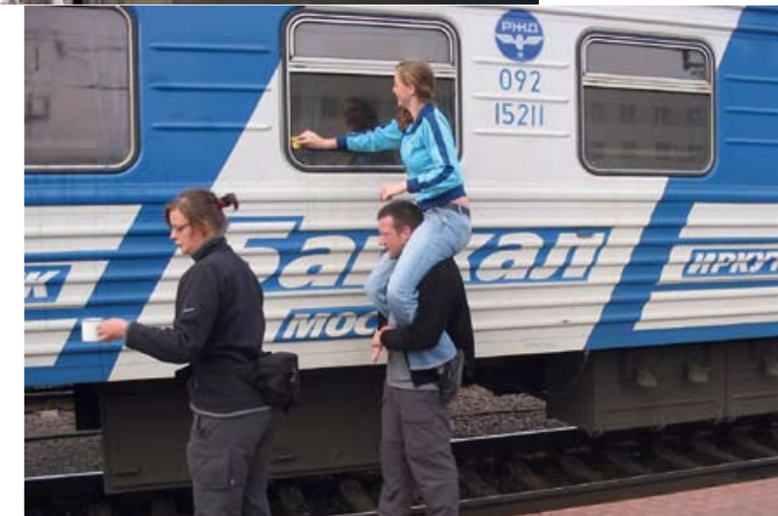
FOTO BOVEN RAMEN VAN DE TREIN WASSEN.

Klimaat en weersomstandigheden hadden - en hebben tot vandaag de dag - nog een zeer directe invloed op het leven van deze nomaden. De herders slaan hun gertenten daar op, waar het gras het groenst is. De graslanden zijn op hun mooist in de lente en in de zomer, als het aangenaam warm is en het gras sappig groen is. Niet ver van de hoofdstad, op zo'n 1,5 uur rijden over hobbelige paden ligt het Natuurpark Terelj. Karakteristiek voor dit landschap zijn de ruige rotspartijen. In Terelj liggen een aantal gertentenkampen en het is mogelijk om hier te overnachten in een traditionele gertent. De gertent heeft vrijwel in heel Mongolië dezelfde indeling. De deuropening is bijvoorbeeld altijd op het zuiden gericht. Mongolen hebben ook veel rituelen en gebruiken ten aanzien van hun dagelijks bestaan en het leven in een gertent. Mongolen zullen bijvoorbeeld nooit op de rijkelijk versierde deur kloppen maar men roept 'Nokhoi Knor' om te vragen of ze binnen mogen komen. Mannen lopen zodra ze een gertent binnenkomen naar links (westen) om bescherming te krijgen van de God van de lucht "Khoimor". De vrouwen gaan rechtsonder de gertent in voor de gunsten van de bescherming van de Zonnegod. Verder is er in een gertent een speciale plek voor gasten en een afzonderlijke plek in het achterste gedeelte voor de ouderen. Tevens worden in het achterste deel de waardevolle bezittingen van de familie bewaard