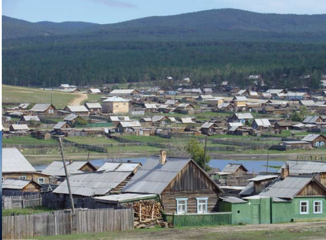
FOTO RECHTS RUSSISCH DORPJE ONDERWEG.