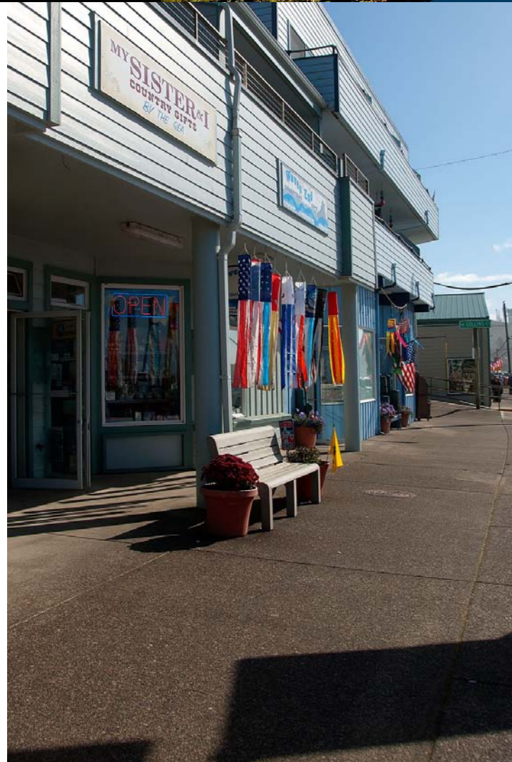
FOTO ONDER TOERISTENWINKELTJES GENOEG.