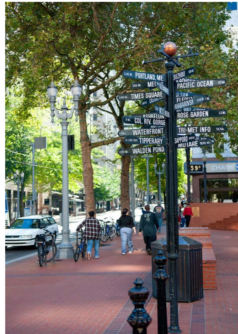
FOTO LINKS BOVEN GENOEG TE BELEVEN IN PORTLAND.