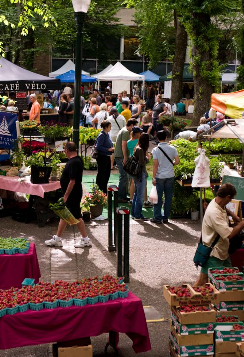
FOTO BOVEN ALLEEN MAAR LOKALE PRODUCTEN OP DEZE FARMERS MARKET.