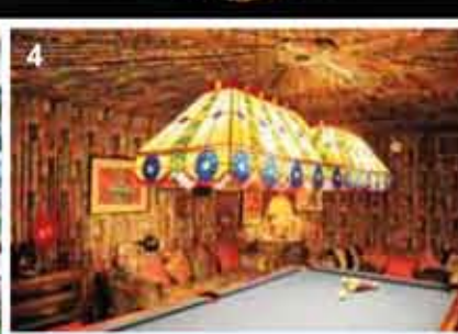
1. De legendarische Sun Studio op Union Avenue in Memphis. 2 en 4. Dat de King een aparte smaak had, daar kunt u in Graceland niet naast kijken. 3. Zijn graf ligt in de tuin van Graceland, bij het zwembad.

Hij bedacht ook de gewaagde kleurencombinatie roze en zwart. "Omdat Elvis zo uitgesproken mannelijk was, kon hij zelfs shocking pink dragen", verdedigt de 82-jarige kleermaker zijn beslissing van toen. "Het allereerste pak dat ik voor hem maakte, kon hij niet betalen."