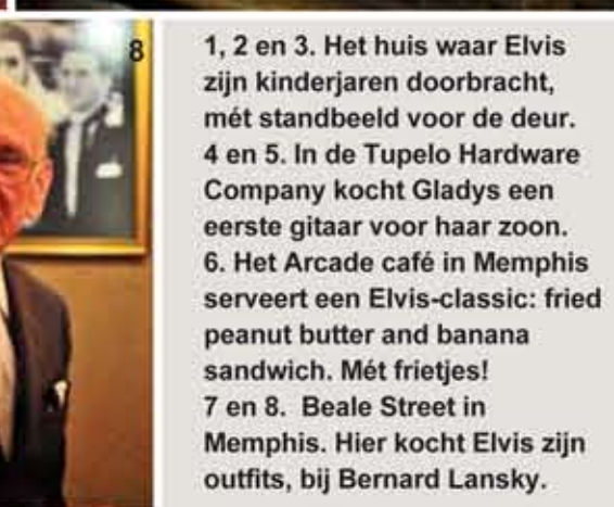
1, 2 en 3. Het huis waar Elvis zijn kinderjaren doorbracht, mét standbeeld voor de deur. 4 en 5. In de Tupelo Hardware Company kocht Gladys een eerste gitaar voor haar zoon. 6. Het Arcade café in Memphis serveert een Elvis-classic: fried peanut butter and banana sandwich. Mét frietjes! 7 en 8. Beale Street in Memphis. Hier kocht Elvis zijn outfits, bij Bernard Lansky.