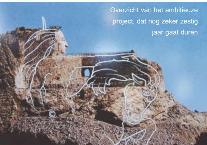
Overzicht van het ambitieuze project, dat nog zeker zestig jaar gaat duren