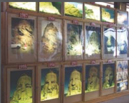
Beeld van Gotzun Borglum

De verschillende stadia van het beeld door de jaren heen