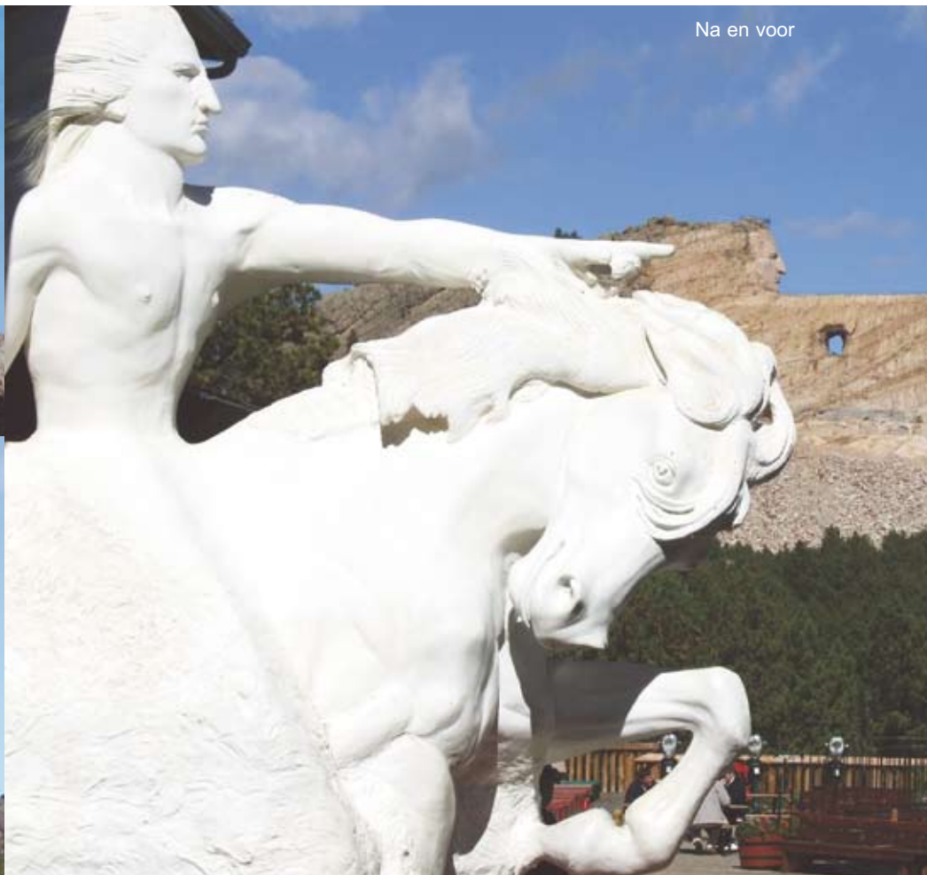
Na en voor