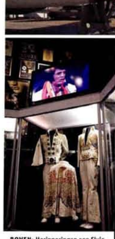
BOVEN: Herinneringen aan Elvis. ONDER: Graceland.