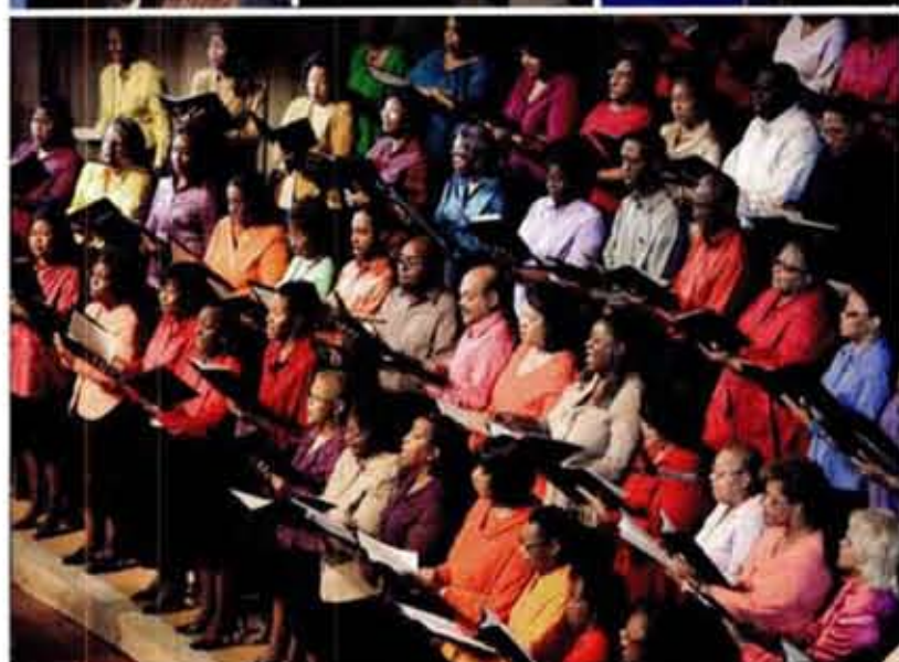
BOVEN Links: Legendarische Sun Studio Midden: National Civil Rights Museum. MIDDEN: Mississippi Boulevard Christian Church.