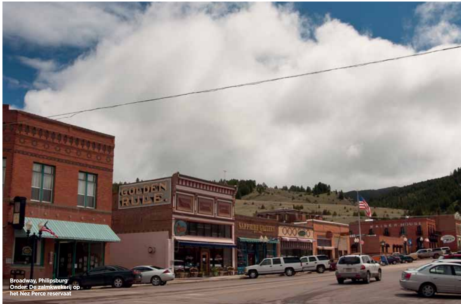
Broadway, Philipsburg Onder: De zalmkwekerij op het Nez Perce reservaat