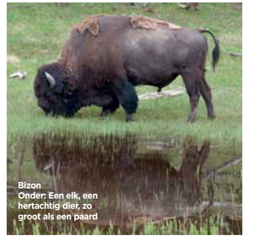
Bizon Onder: Een elk, een hertachtig dier, zo groot als een paard