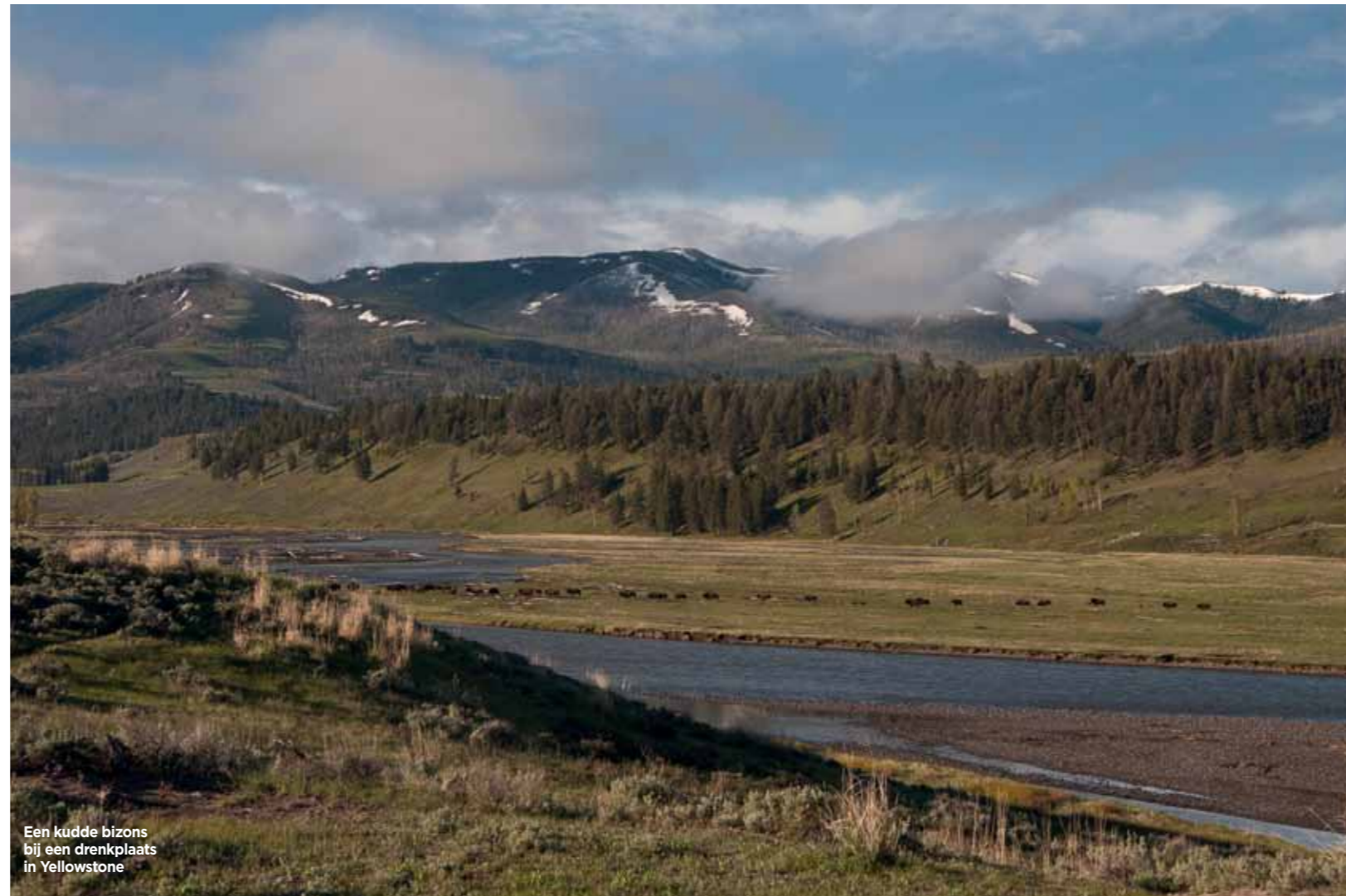
Een kudde bizons bij een drenkplaats in Yellowstone

■ In 1855 dwong Washington de Nez Perce zich te vestigen op het reservaat. De helft van de mensen weigerde. Toen de regering hen in 1877 poogde te dwingen op het reservaat te gaan wonen (er was goud gevonden in de omgeving en blanken stroomden massaal toe) brak er oorlog uit. Drie legermachten achtervolgden Chief Joseph en zijn mensen door Idaho en Montana toen zij poogden naar Canada te vluchten. Veertig mijl voor de grens werden ze ingehaald en na vijf dagen vechten verslagen. De nakomelingen van de opstandelingen vormen tot de dag van vandaag een gescheiden gemeenschap op het reservaat. Zij staan bekend als de "non-treaty indians", degenen die zich niet bij het verdrag van 1855 neerleggen.