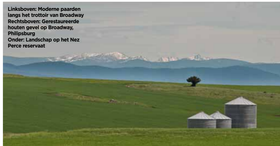
Linksboven: Moderne paarden langs het trottoir van Broadway Rechtsboven: Gerestaureerde houten gevel op Broadway, Philipsburg Onder: Landschap op het Nez Perce reservaat

‘Negentig procent van de toeristen rijdt van de ingang rechtstreeks naar Old Faithful en gaat weg zodra hij heeft gespoten’