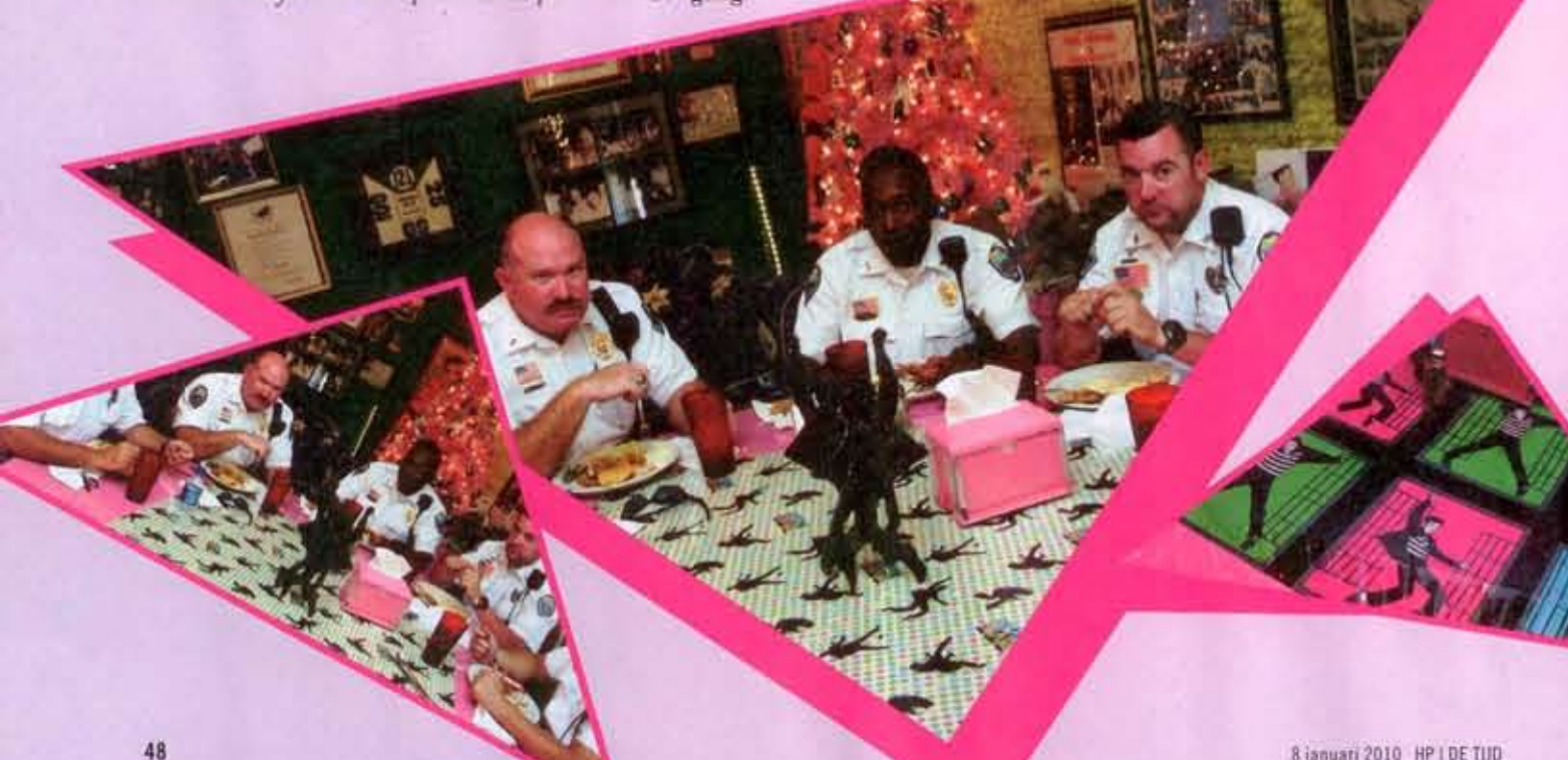
8 januari 2010 - HP | DE TUD

sche sprong naar de onsterfelijkheid. De originele Ampex-recorders, de vintage 50's RCA-microfoons en het kleine museum op de bovenverdieping maken van Sun Recording Service een ware tijdmachine. Ook zonder het statistisch overzicht te lezen van Elvis' carrière – zo'n 1 miljard verkochte platen, 100 gouden singles, 50 gouden albums, rollen in 33 films en ontelbare live-optredens – beseft je dat hier geschiedenis werd geschreven. Was de Elvis-poster van mijn broer nog voorhanden, dan zou ik er thuis nog wel een plek voor vinden. | Elvis' 75ste geboortedag wordt gememoreerd met allerlei evenementen, zoals op 8 januari in de Amsterdamse Melkweg en op 24 februari in het Rotterdamse Ahoy. Foto's van de Elvis-trip van Paul van Riel zijn van 8/11/30 januari te zien bij de Kunsttuin Amsterdam.