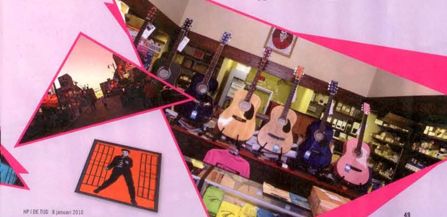
HP | DE TUD - 8 januari 2010