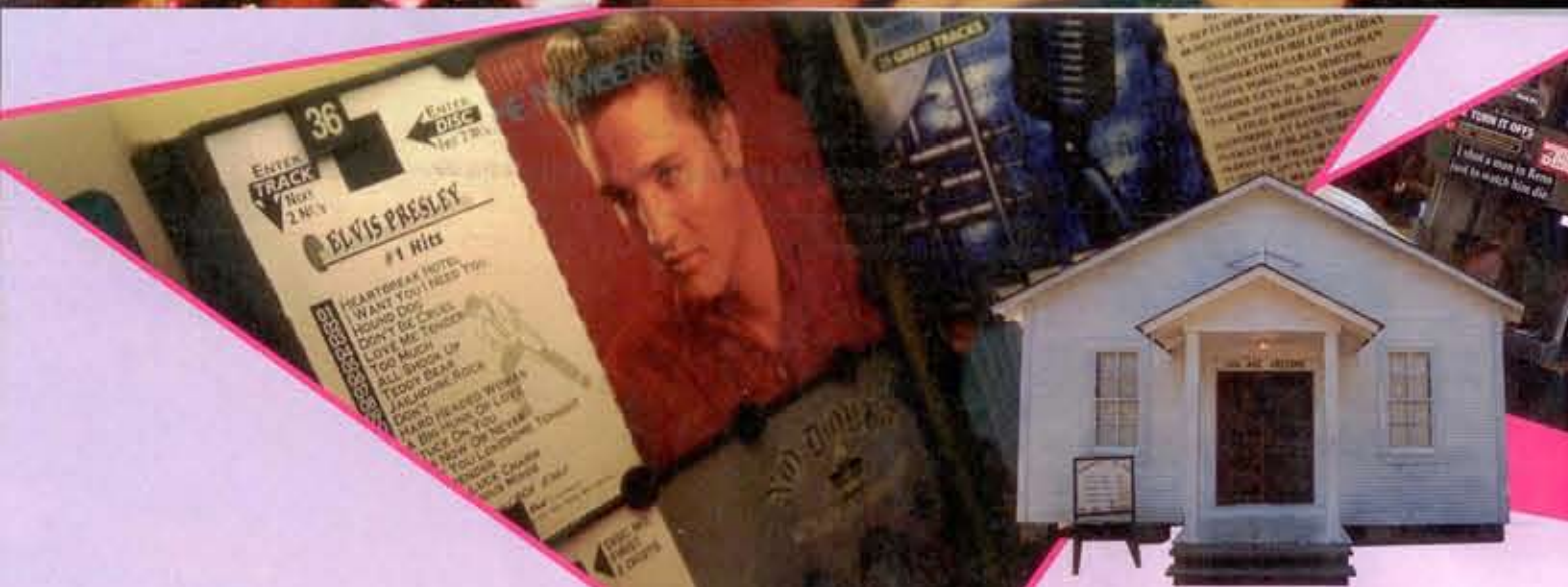
De kapel in Tupelo, waar Elvis gospels hoorde