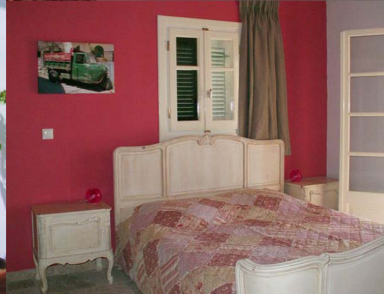
FOTO LINKS ONDER EÉN VAN DE 3 SFEERVOL INGERICHTE SLAAPKAMERS VAN VILLA ELIÁ.