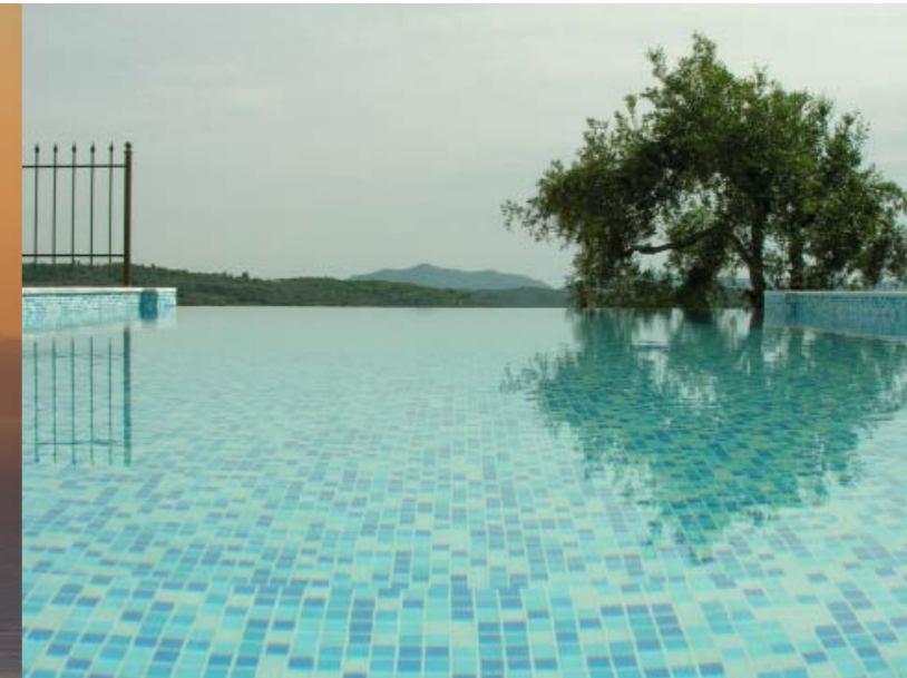
FOTO LINKS BOVEN UITZICHT OVER DE ZEE VANAF VILLA ELIÁ BIJ ZONSOPKOMST .