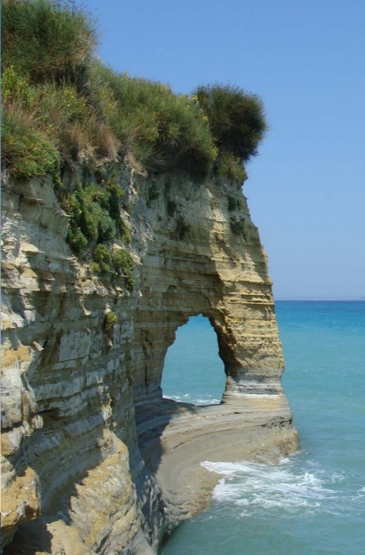
FOTO BOVEN PRACHTIGE KUSTLIJN BIJ SIDARI, NOORD-CORFU.