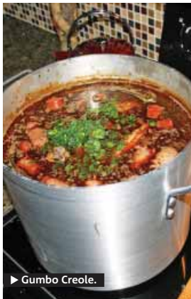
► Gumbo Creole.