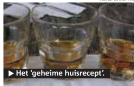
► Het 'geheime huisrecept'.

Gek genoeg, bieden vrouwen hun borsten ervoor aan.