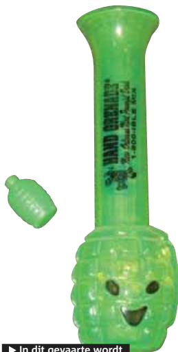
► In dit gevaarte wordt de rum gepresenteerd.

Net zoals in New York niemand zijn stad 'The Big Apple' noemt, noemt niemand in New Orleans het de Big Easy.