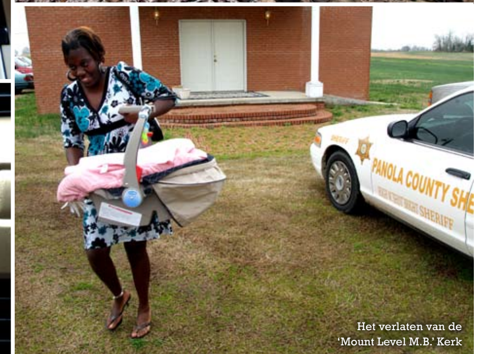
Het verlaten van de 'Mount Level M.B.' Kerk