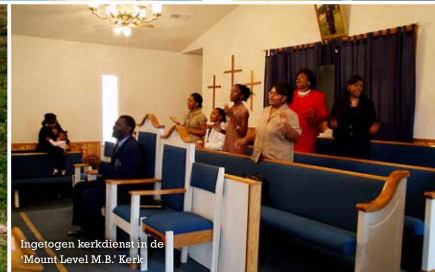
Ingetogen kerkdienst in de 'Mount Level M.B.' Kerk