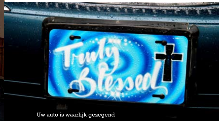
Uw auto is waarlijk gezegend