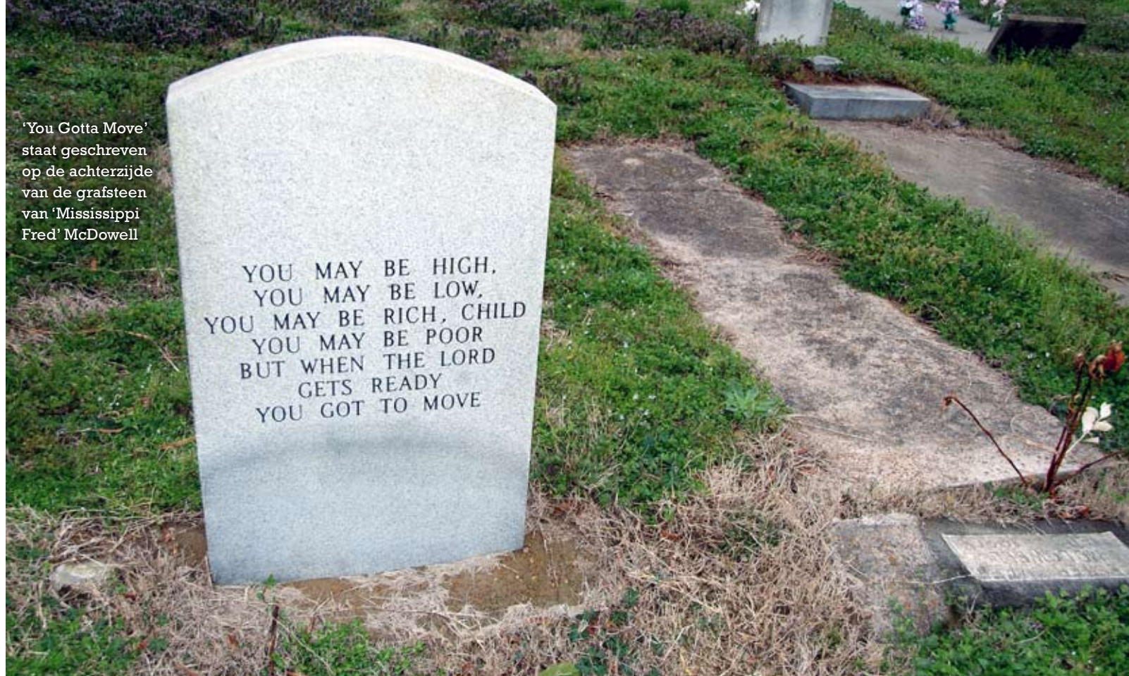
'You Gotta Move' staat geschreven op de achterzijde van de grafsteen van 'Mississippi Fred' McDowell

YOU MAY BE HIGH, YOU MAY BE LOW, YOU MAY BE RICH, CHILD YOU MAY BE POOR BUT WHEN THE LORD GETS READY YOU GOT TO MOVE