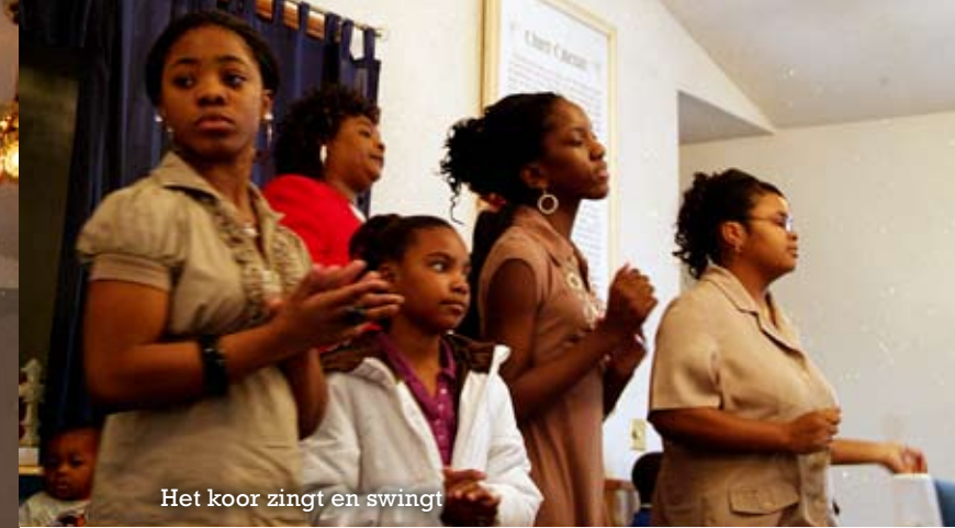
Het koor zingt en swingt