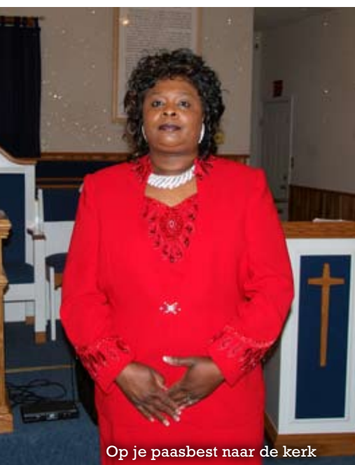
Op je paasbest naar de kerk