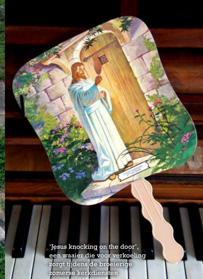
'Jesus knocking on the door', een waaijer die voor verkoeling zorgt tijdens de broeierige zomerse kerkdiensten

YOU MAY BE HIGH, YOU MAY BE LOW, YOU MAY BE RICH, CHILD YOU MAY BE POOR BUT WHEN THE LORD GETS READY YOU GOT TO MOVE