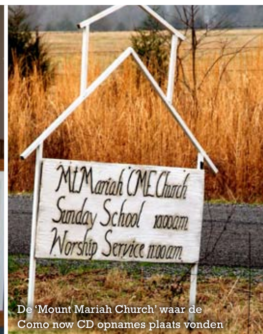
De 'Mount Mariah Church' waar de Como now CD opnames plaats vonden