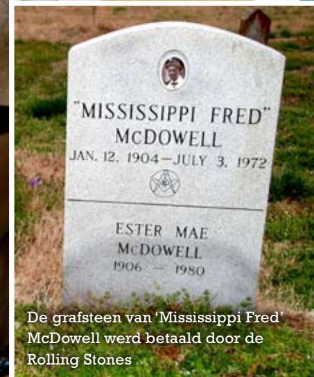
De grafsteen van 'Mississippi Fred' McDowell werd betaald door de Rolling Stones