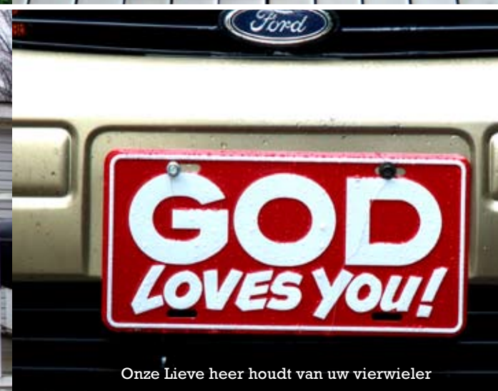
Onze Lieve heer houdt van uw vierwieler