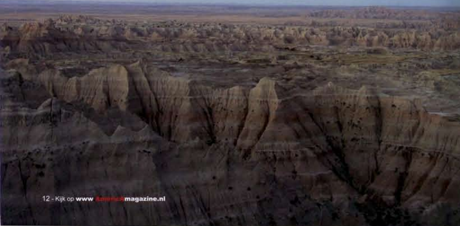
Badlands National Park meet meer dan 967.000 vierkante kilometer

De huidige dierenwereld heeft zich noodgedwongen aangepast, evolutie maakt vindingrijk. Tijdens de rit over de Badlands Loop Road kom je de meest voorkomende soorten wel tegen. Konij-