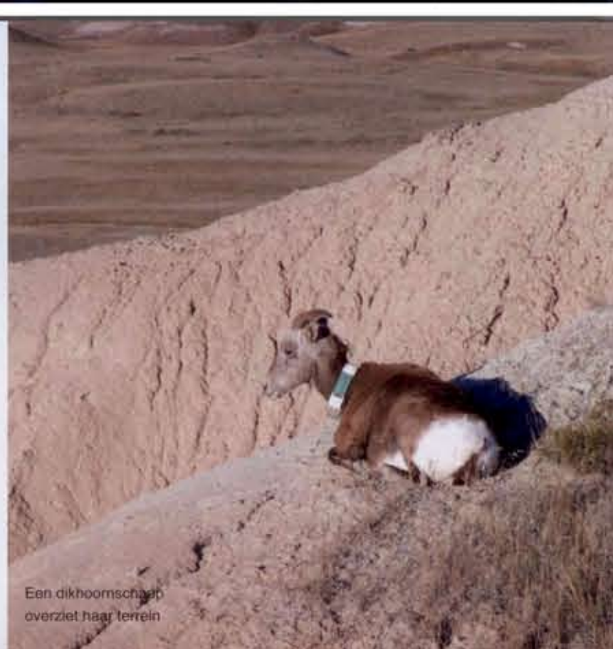
Een dikhoornschaap overziet haar terrein

In de wetenschap dat we getuige zijn van hoe de elementen korte metten maken met berg en bos kun je makkelijk verdrietig worden om zoveel verspillings. Aan de andere kant zie je hier hoe dieren en planten zich gaandeweg aanpassen aan het gebied, en wordt duidelijk dat de Badlands vooral een dynamische wereld vormen waarin de tijd tegelijkertijd kostbaar is en te verwaarlozen valt. De natuur gaat een stapje verder dan Michelangelo en laat hier onvermurwbaar zien dat er in steen niet één, maar ontelbare beelden gevangen zitten. En daar hoeft geen beeldhouwer aan te pas te komen. ■