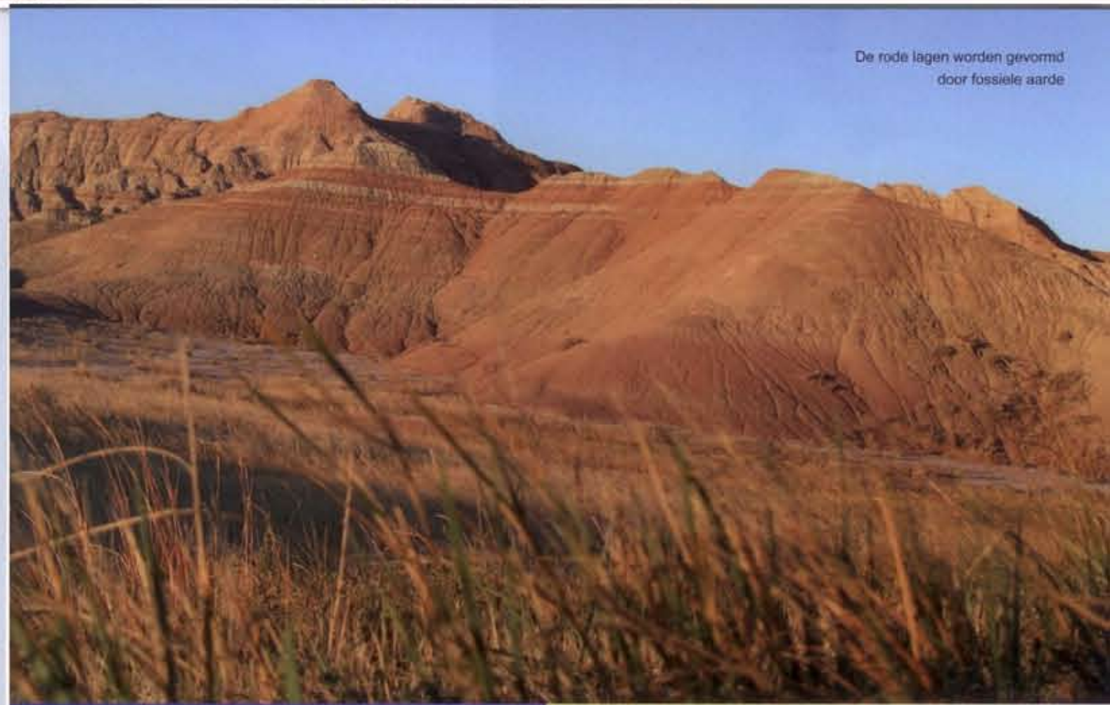
De rode lagen worden gevormd door fossiele aarde