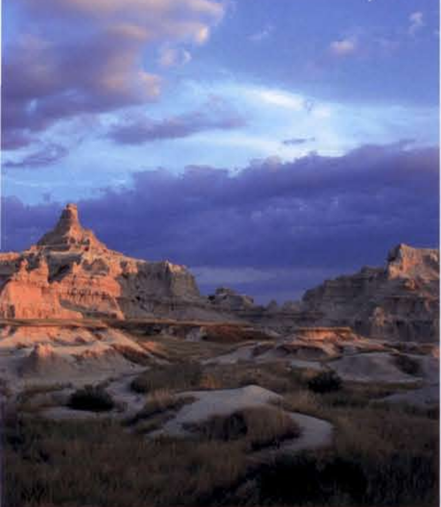
Boven: Een prachtige plek om je tent op te staan Linksonder: Konijnen te over Rechtsonder: Ook de eerste Franse kolonisten spraken van 'mauvaise terres à traverser'

nen te over, en de aanwezigheid van gaffelantilopen op de wal is haast lastig te noemen. Binnen vijfhonderd meter zie ik bovendien schichtige prairiehonden als de bliksem verschijnen en verdwijnen, wandelen muilberden doodgemoedereerd over de prairie, en ligt er een dikhoornschaap op een rotspunt in tranen naar de horizon te staren. Een stuk zeldzamer is de zwartvoetmuis, de enige inheemse frettensoort van Amerika, waarvan er nu maar een stuk of vijftig in dit park leven. Stiekem hoop ik echt op een andere zeldzaamheid, de bizon. Tevergeefs, want de het park levende kudde van vierhonderd exemplaren kijkt wel beter uit dan zich rond de Loop te begeven.