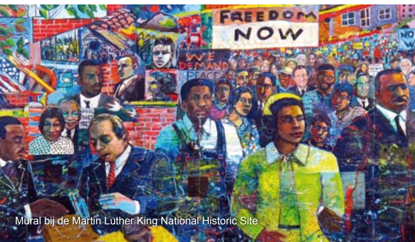
Mural bij de Martin Luther King National Historic Site

schakeld moet worden. Op een scherm rechts bovenin zien we tot onze verbazing een coladrinkende, twitterende presentatrice die echter precies op tijd weer paraat is om live de uitzending in te gaan. Volgende stop is Studio 7E waar Jason ons uitleg geeft over de teleprompter. Hierop is de tekst te zien die de nieuwslezers voorlezen. Deze staat trouwens op maximaal vier woorden per regel om te voorkomen dat we thuis kunnen zien dat de tekst wordt voorge-