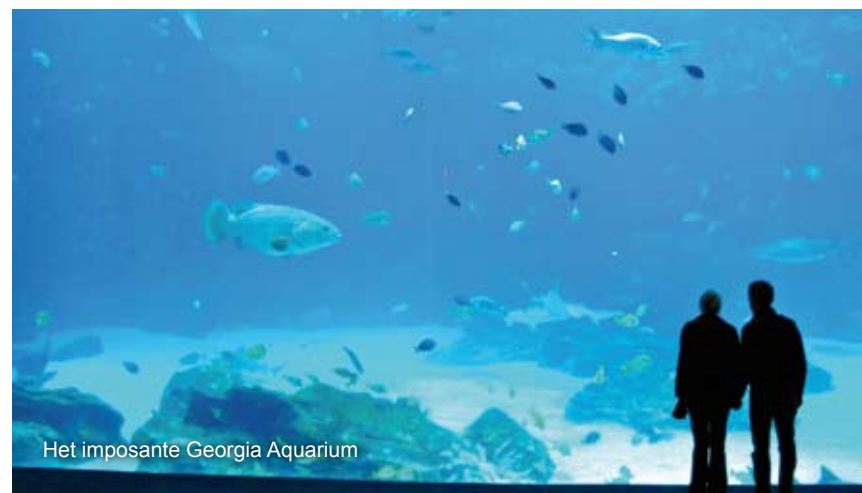
Het imposante Georgia Aquarium